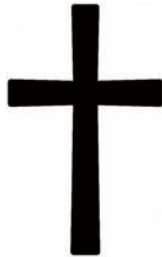
Christoph Schmall, 1. Bürgermeister